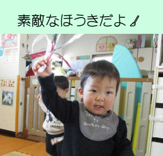
素敵なほうきだよ！