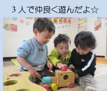
3人で仲良く遊んだよ☆