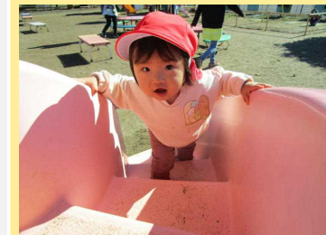
階段よしよよしよ！