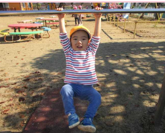
カいっばい掴まるよ！