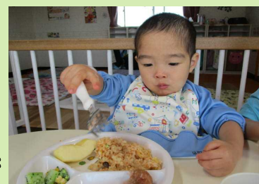
モグモグよく噛んで食べるよ