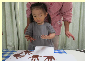
手形ぺったん面白いね！