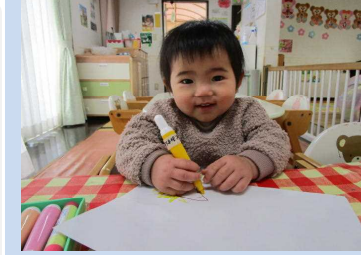
マーカーぐるぐる楽しいね