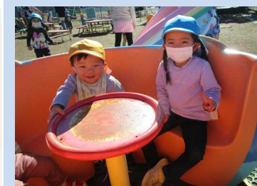
お姉ちゃんと一緒に◎