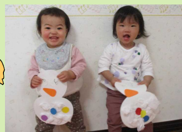
雪だるま上手にできたよ